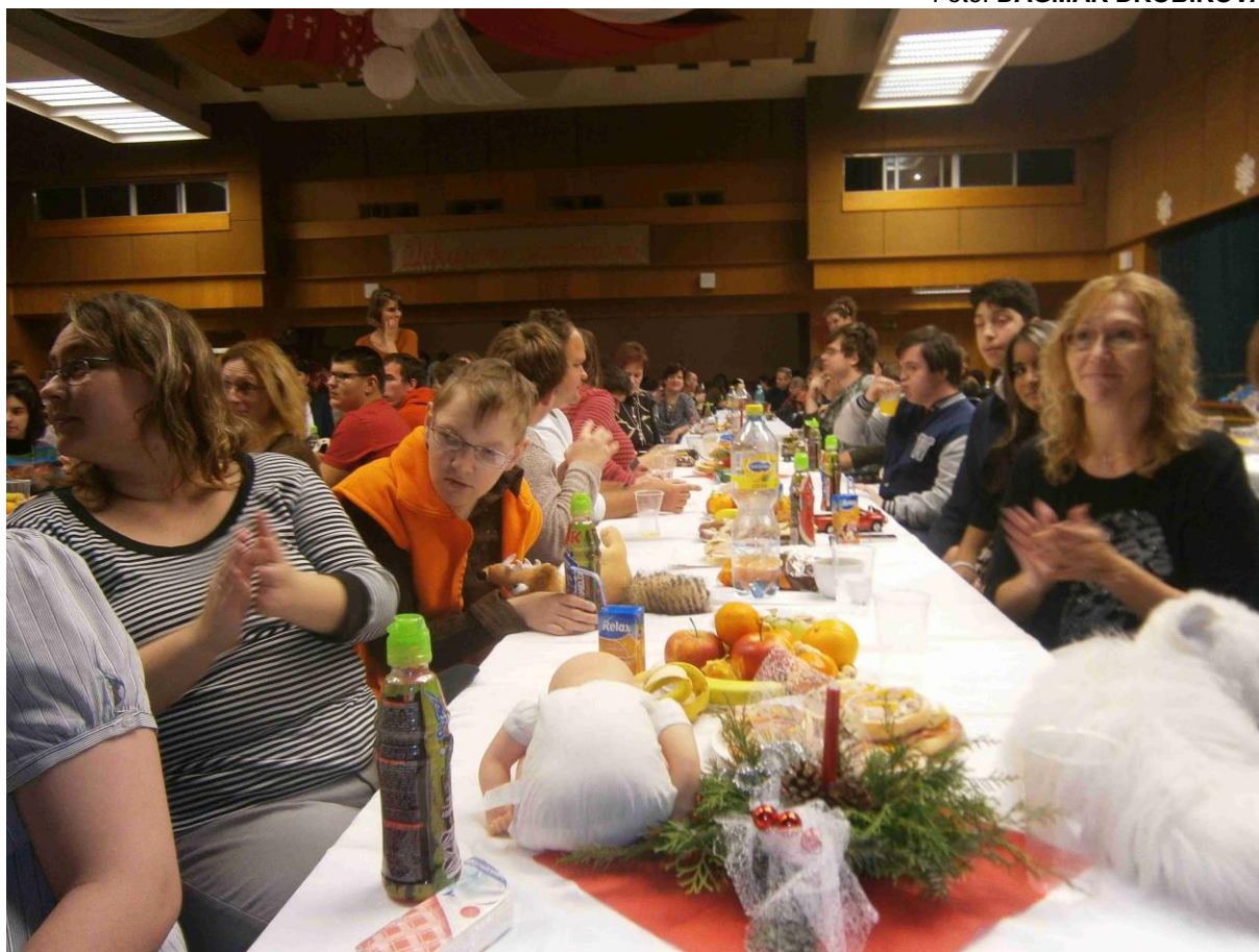
Ze společného setkání lidí se zdravotním postižením „Děti dětem“ v Dolním Benešově 3. prosince 2014.