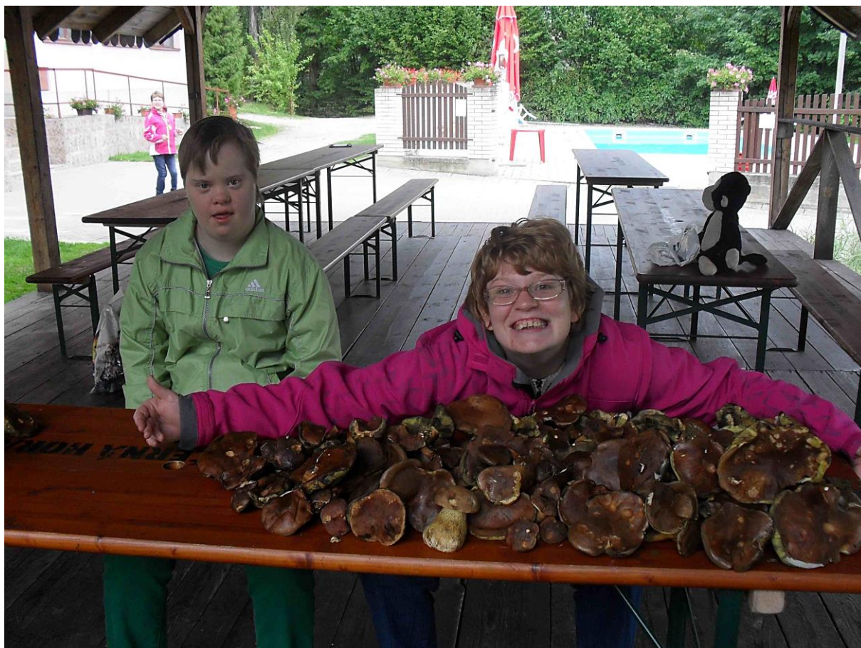
Takovou houbovou úrodu jsme mohli Verunce s Petrou jen závidět...

Zaznamenala: MARTINA SCHOFFEROVÁ Domov Barevný svět