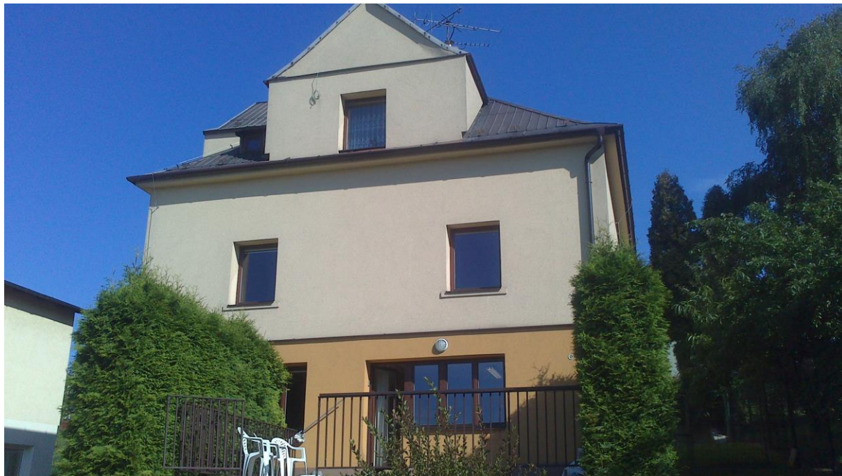
Pohled ze zahrady na budovu vilky, v níž zanedlouho vznikne nové Chráněné bydlení Bronzová.