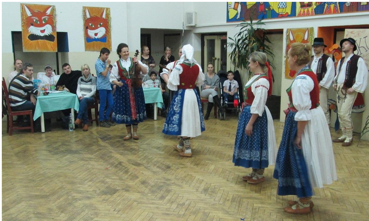
Na snímku: členové folklorního souboru Morava, kteří byli letošními hosty „Liščího plesu“ v Domově na Liščině.