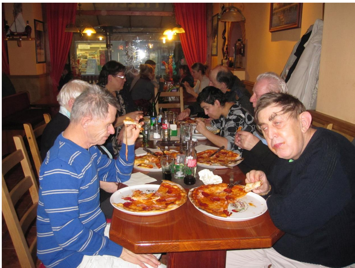
Klienti Domova na Liščině na večeři v pizzerii Opatia v centru Ostravy.

Uživatelé domácnosti D2 Domova na Liščině Text upravila Kateřina Hejduková