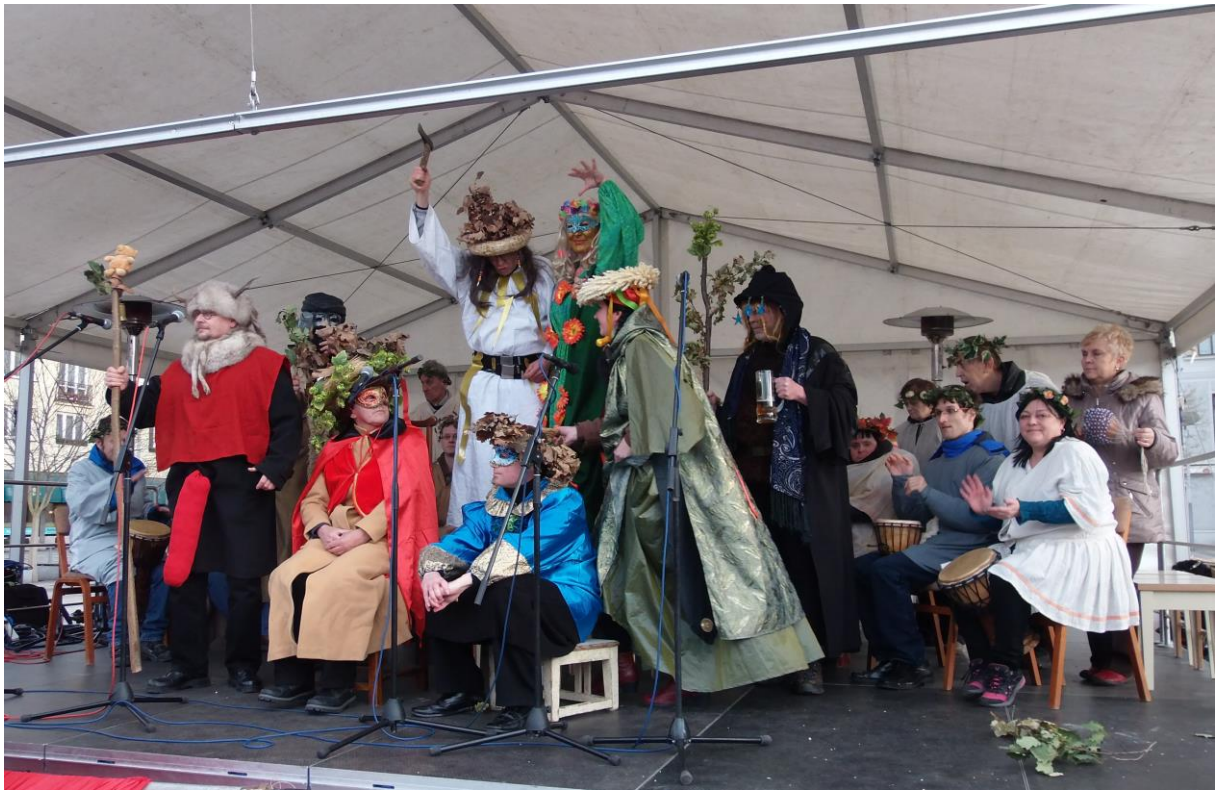
Na snímku nahoře naše Rytmus „v zajetí“ pohanských bohů, dole dva symboly letošního Ostravského Masopustu: Morena a Veledub...