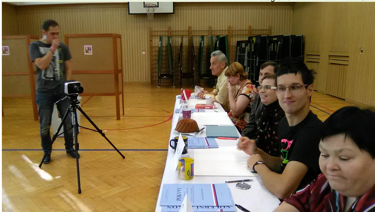
Záběr z natáčení filmů Volič v tělocvičně Domova Barevný svět, která se na chvíli změnila ve volební místnost a naši klienti ve volební komisaře...