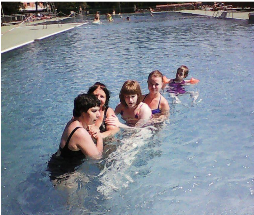
Letní radovánky v bazénu ostravské Sarezy...