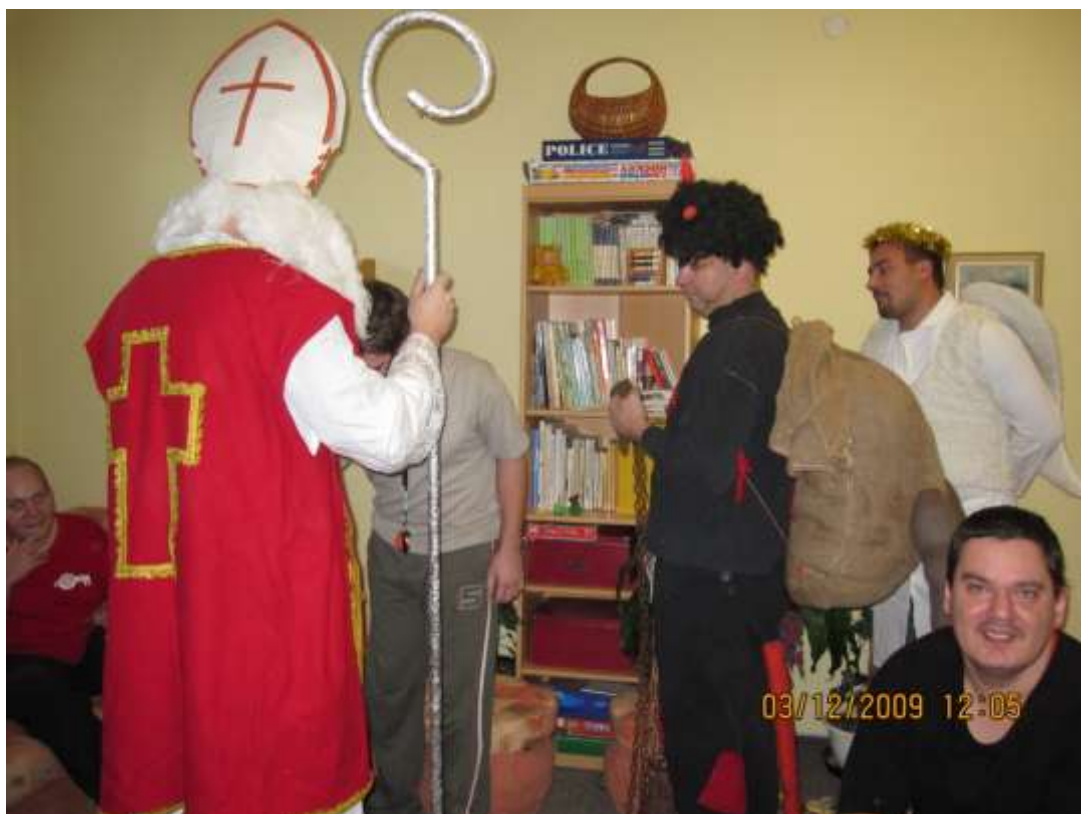
Mikulášská nadílka v Centru pracovní výchovy...