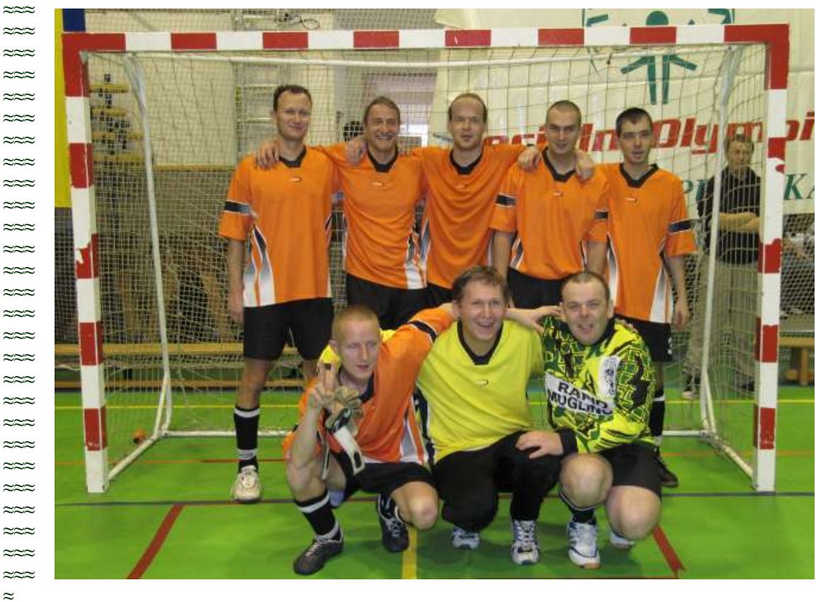
Na snímku dole: Fotbalový tým Medvědi ze Stacionáře Třebovice na Zlínském poháru.