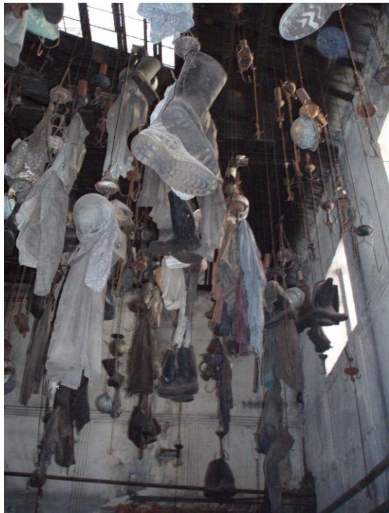
Na snímku nahoře: řetízková šatna havířů.