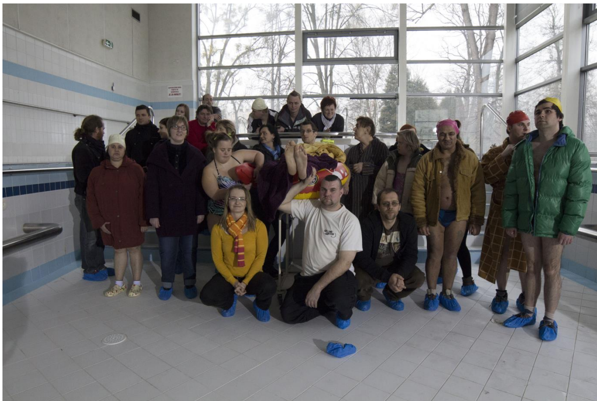
Filmový štáb po natáčení ve vypuštěném bazénu v Lázních Darkov. Na předcházející straně: z natáčení v zimním jezdišti bývalých stájí v areálu Domova Barevný svět.