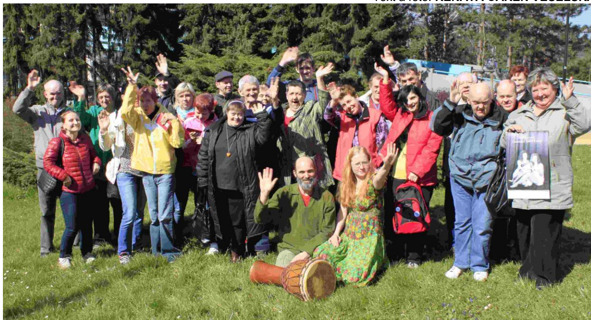
Účastníci muzikoterapeutického setkání na společném snímku...