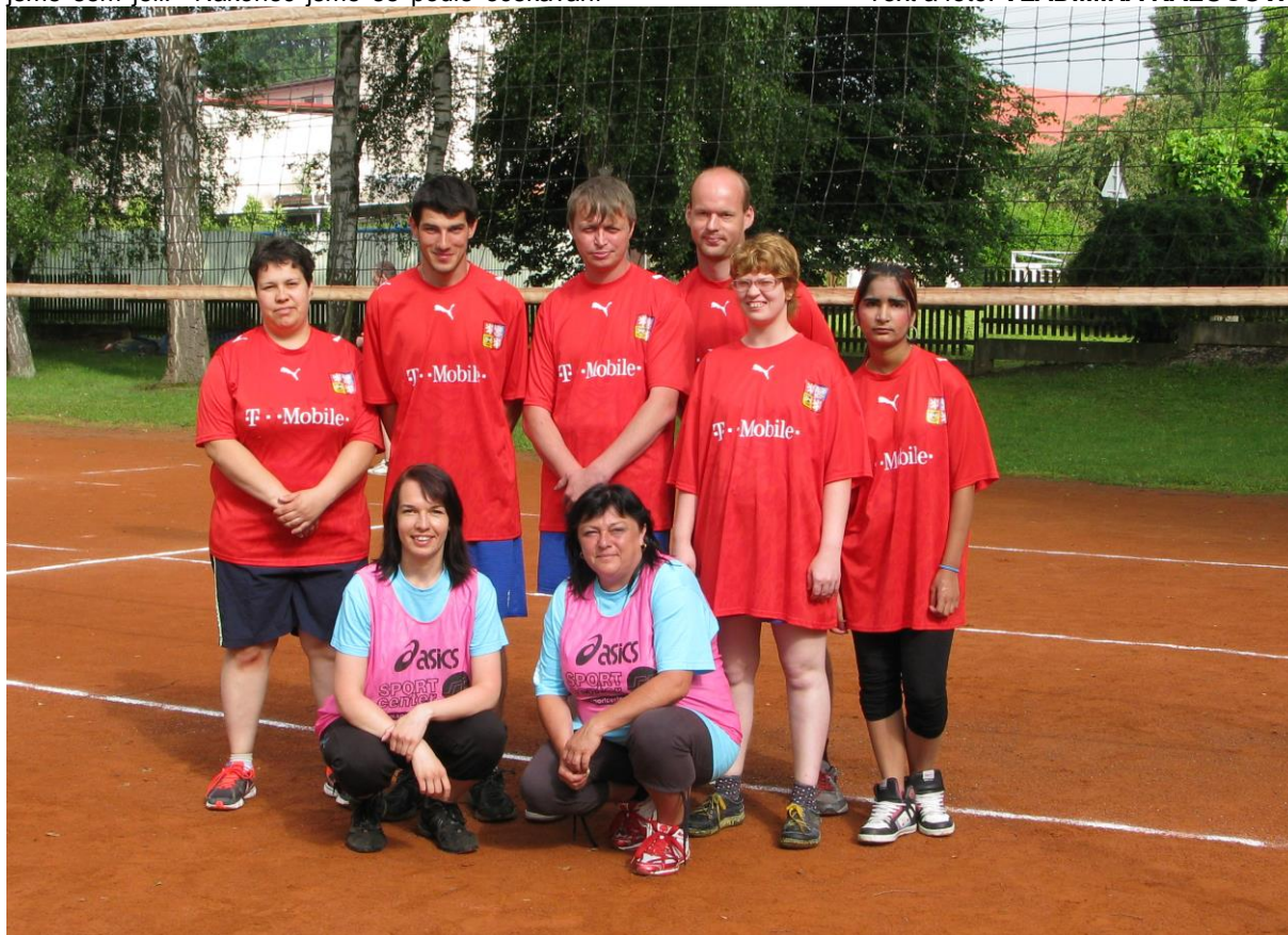
Náš reprezentační tým na národním turnaji Českého hnutí speciálních olympiád v Dřevěnici.