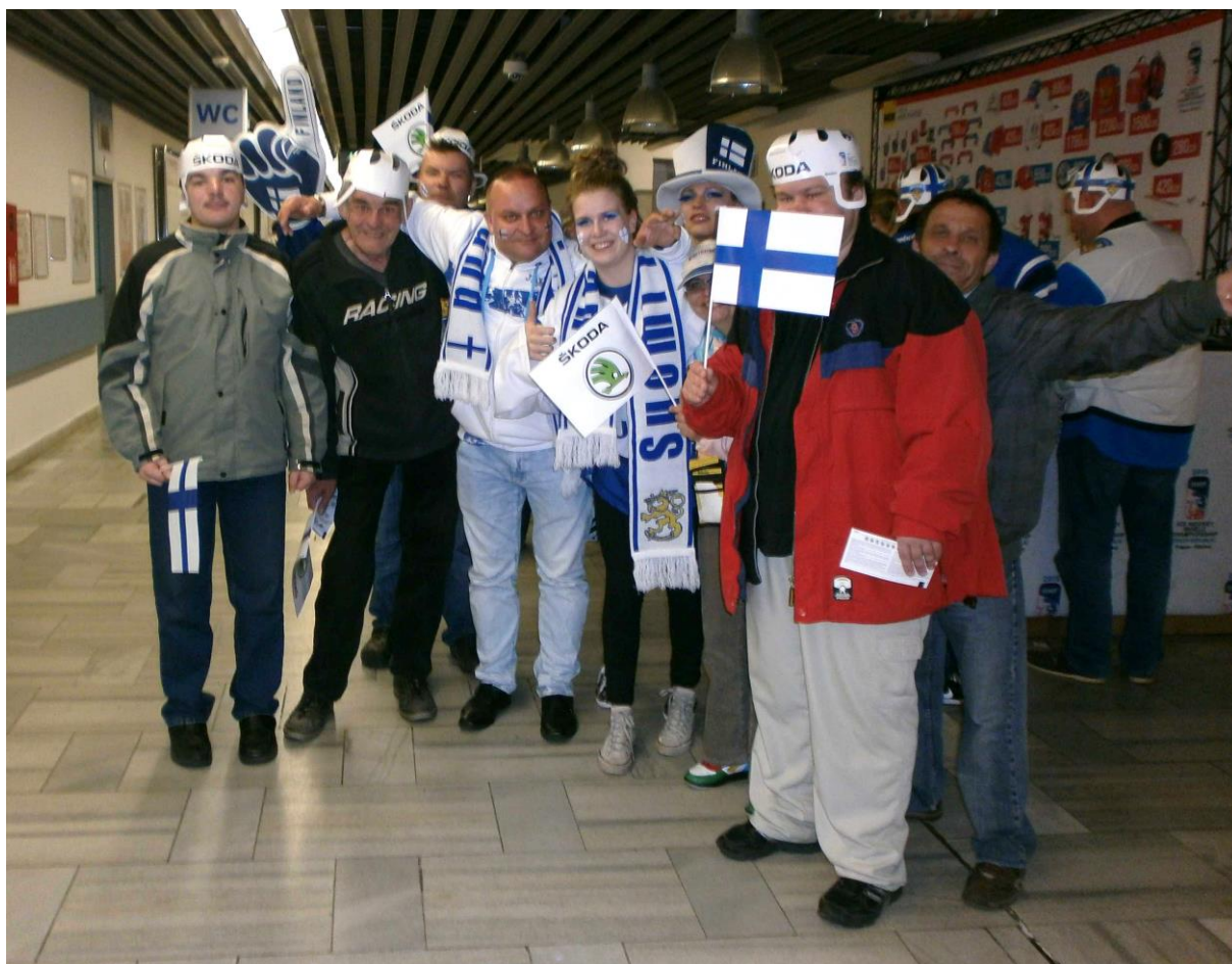
Naši klienti ze Stacionáře Třebovice spolu s finskými hokejovými fanoušky v ostravské ČEZ Aréně.