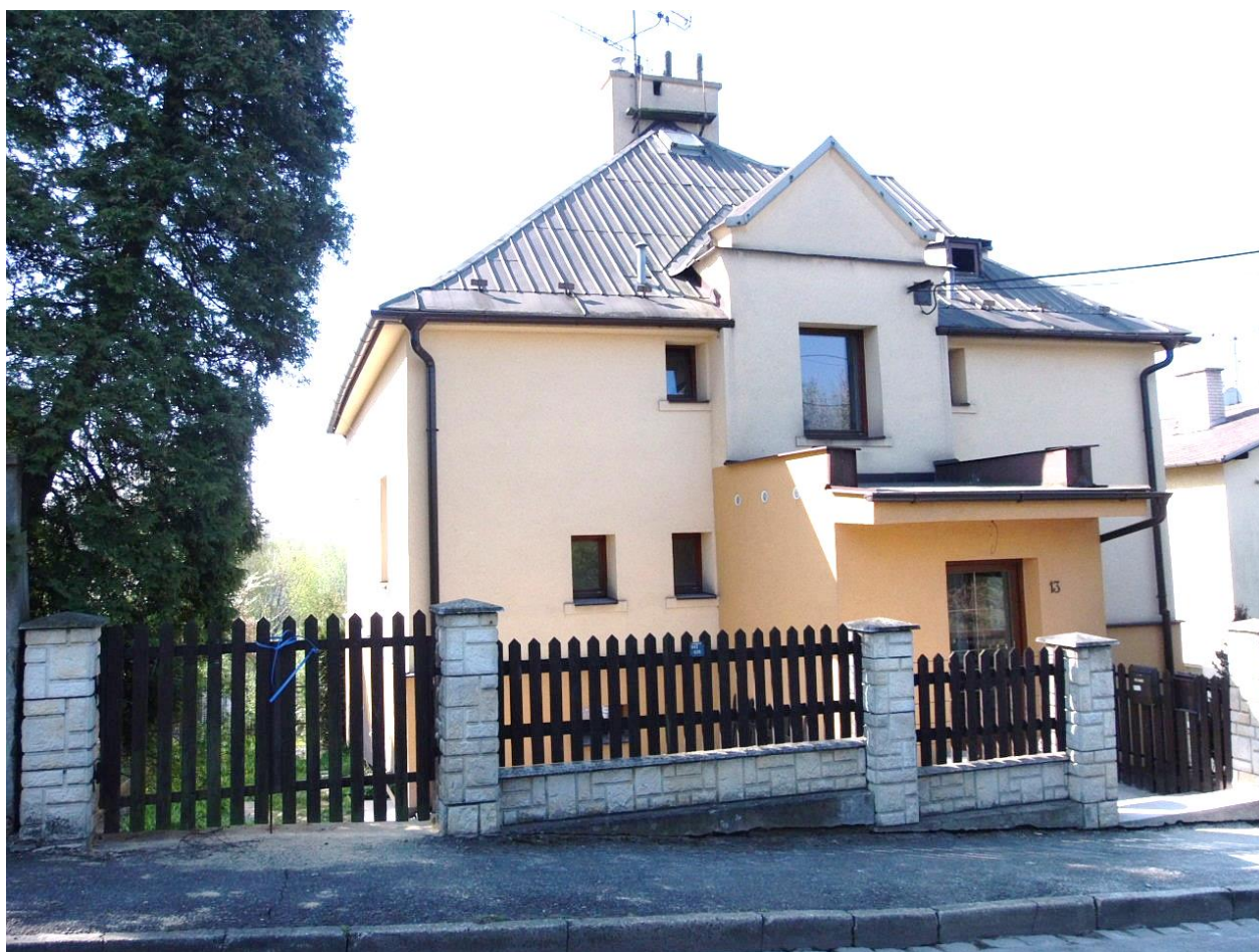
Vilka nového chráněného bydlení Čtyřlístku v Bronzové ulici na Slezské Ostravě.