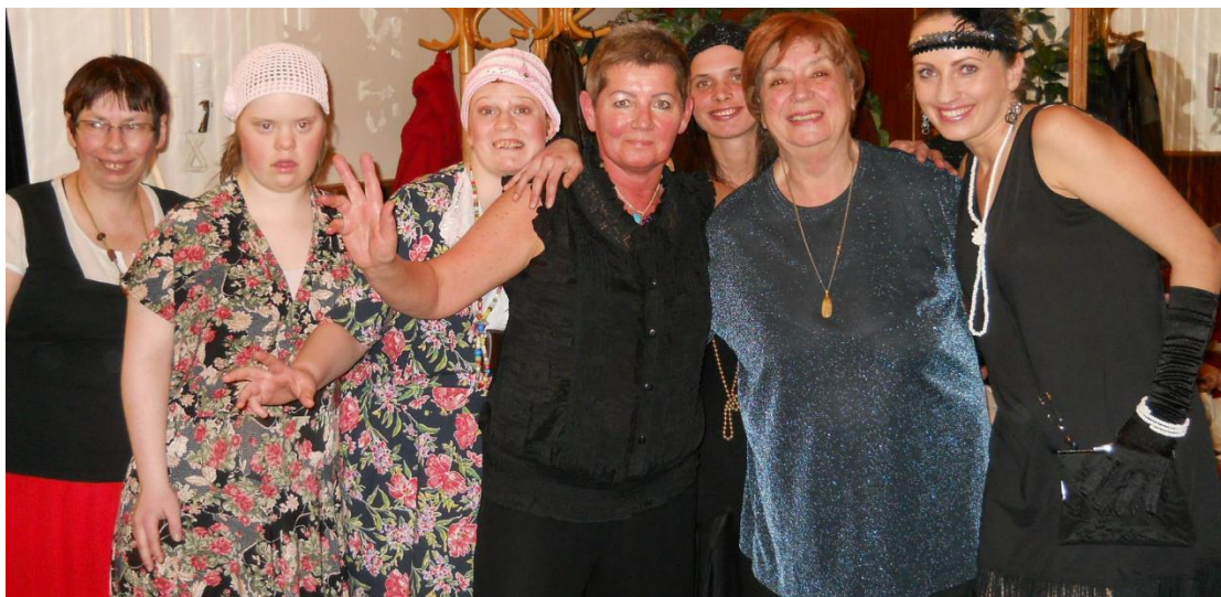
Na snímku vlevo naše reprezentantky v Semilech spolu s herečkou Miriam Kantorkovou (druhá zprava).

Text a foto: MARCELA ŠTĚPÁNOVÁ a IVANA HEFKOVÁ