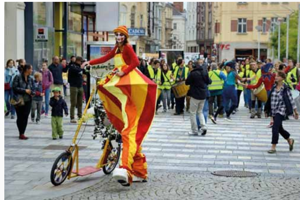
Cirkusu trochu jinak